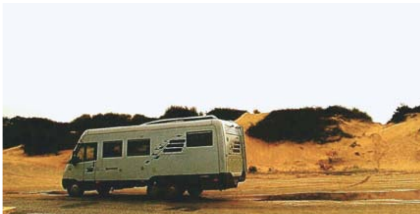
Stellplatz am Atlantik