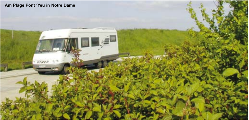
Am Plage Pont 'Yeux in Notre Dame