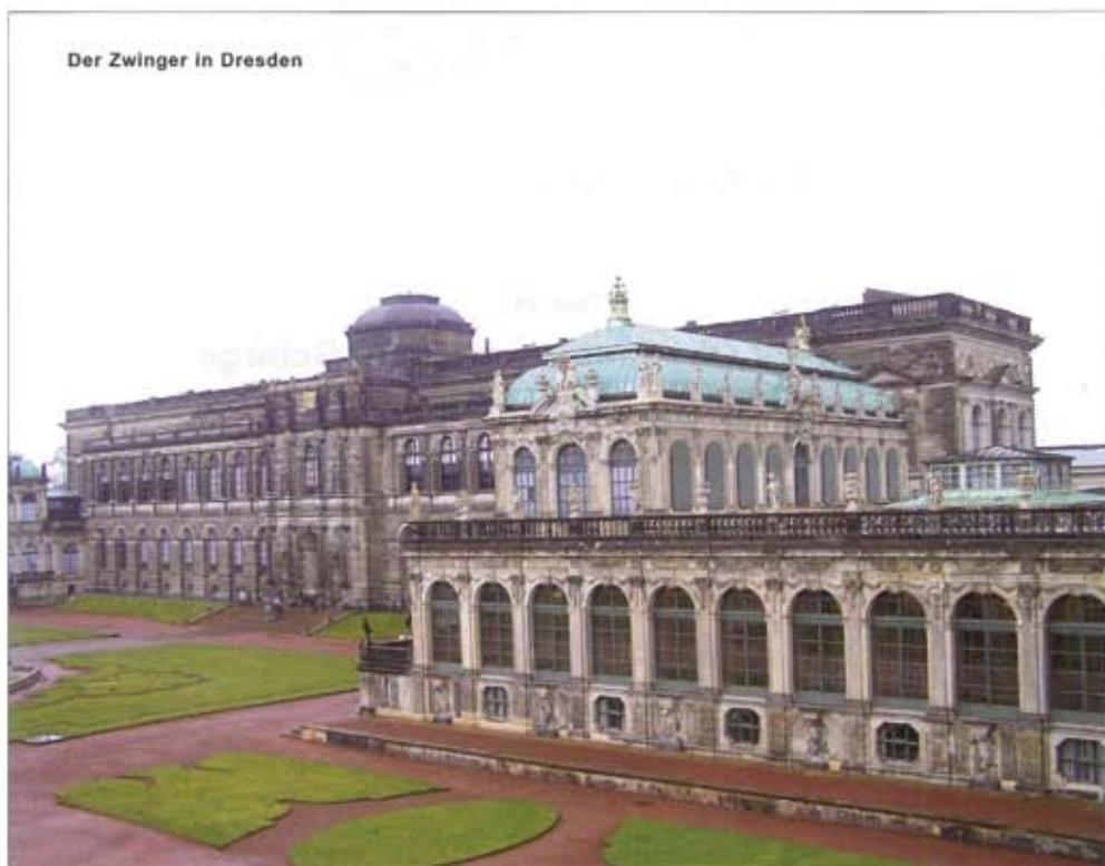
Der Zwinger in Dresden